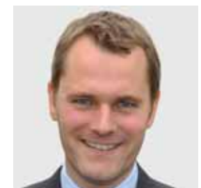
Daniel Bahr Bundesgesundheitsminister

09.30 – 10.00 Uhr Ansprache des Bundesgesundheitsministers